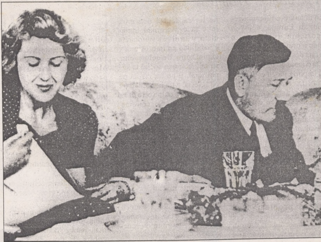
Aki por mira un foto di file di Adolf Hitler y Eva Braun, kendenan a casa den un bunker na 1945 y segun informenan lo a comete suicidio hunto.

Segun informenan di "Reichsbank" pa 1939 e reservanan di oro tabata completamente bashi. Ora e avanse Aleman a cuminsa e paisnan Europeo desde Checoslovaquia te na Luxemburg a manda tur nan oro pa Merca. 350 Tonelada di oro cu a worde bendi door di Nazinan cu Suiza a worde warda den cahanan y transporta pa e ciudad di Berna den treinnan Frances di e gobierno di Vichy. Pa e oro aki e Nazinan a cobra